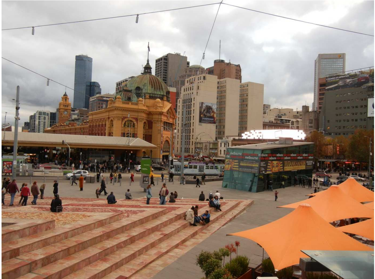
Vue depuis Federation Square sur Flinder Station, la gare ferroviaire.